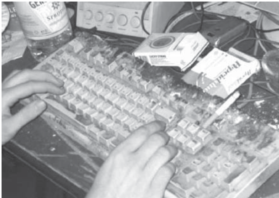
Beim Computerfreak (gefunden im Internet)

Sie zeigte hinsichtlich ihrer Internetsucht ein mangelndes Problembewusstsein und sah sich mit gravierenden familiären Problemen und Vorwürfen konfrontiert. In der Folge kam es zu Entfremdung vom Ehemann und den Töchtern. Dies führte schließlich doch zu der Einsicht, dass sie sich nach dem Internet so süchtig fühlte, wie andere Menschen nach Alkohol. Sie konnte anschließend ihr Konsumverhalten