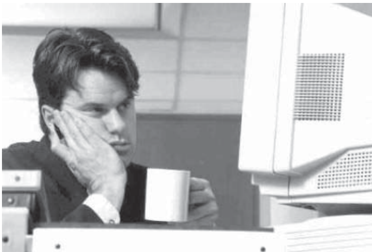
Irgendwann ist es genug

Auf der anderen Seite gibt es die Kritiker des Begriffs Internetsucht, der ihrer Meinung nach als Beschreibung des Phänomens nicht zutreffend ist. Um das problematische Verhalten als Sucht bezeichnen zu können, fehlt die stoffliche Ebene, die körperliche Abhängigkeit samt schwerster bis lebensbedrohlicher Entzugssymptome hervorruft. Außerdem sei nach Ansicht dieser Kritiker noch unzureichend geklärt, was genau beim Internet süchtig macht.